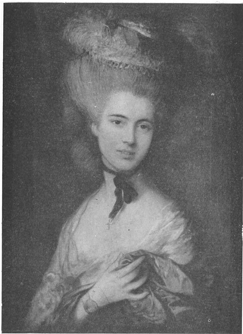
Гейнсборо. Портрет герцогини де Бофор.