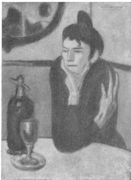
Пикассо. Любительница абсента.