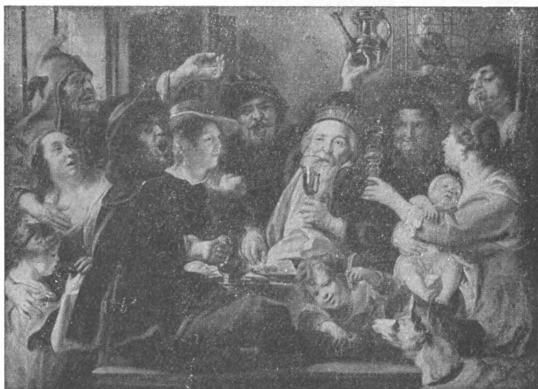
Иорданс. Бобовый король.