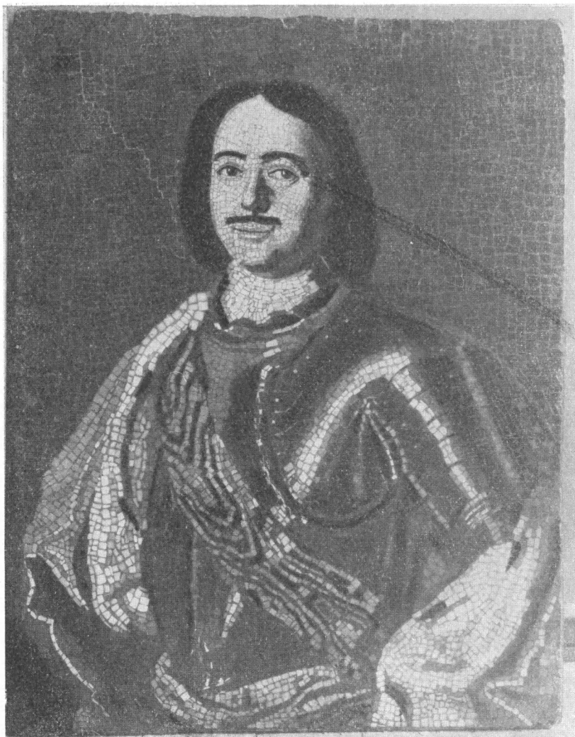
М. В. Ломоносов. Портрет Петра I. Мозаика