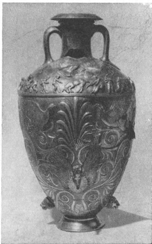
Серебряная амфора для вина. Чертомлыцкий курган. IV в. до н. э.