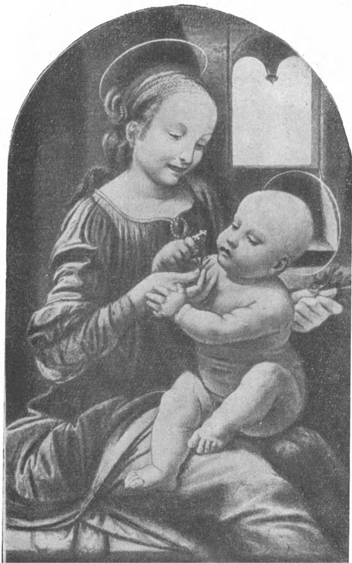
Леонардо да Винчи. Мадонна с цветком.