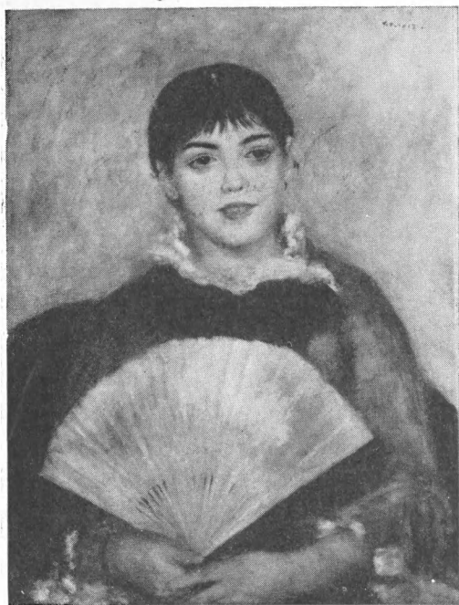
Ренуар. Девушка с веером.