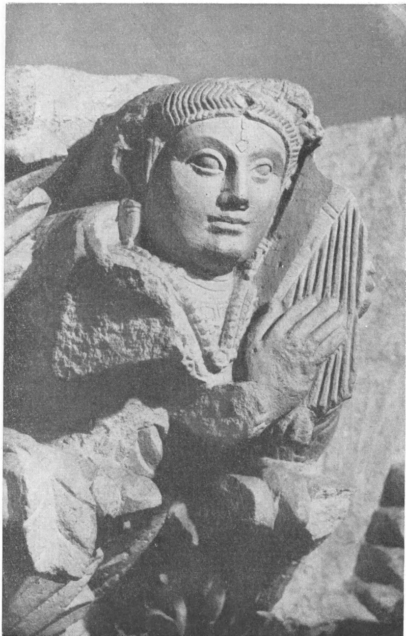
Часть фризa здания из Айртама. Начало I в.